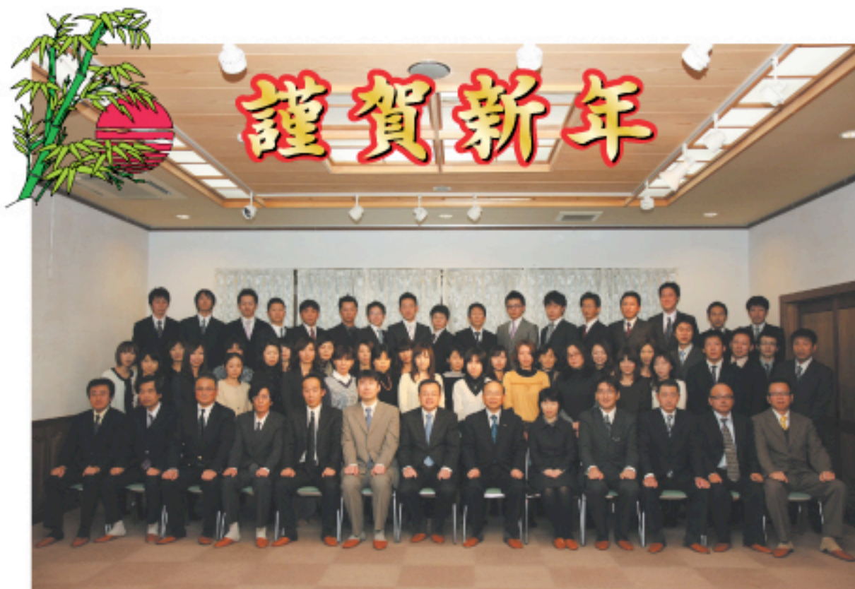
税理士法人 飛驒会計事務所 スタッフ一同